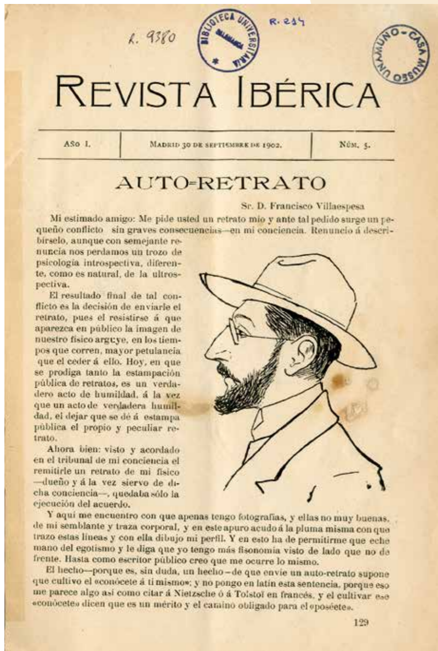
Revista Ibérica, 1. urtea, 5. zenbakia, Madril, 1902ko irailaren 30a. / Revista Ibérica, año 1, nº 5, Madrid, 30 de septiembre de 1902. CMU, REV. 214.