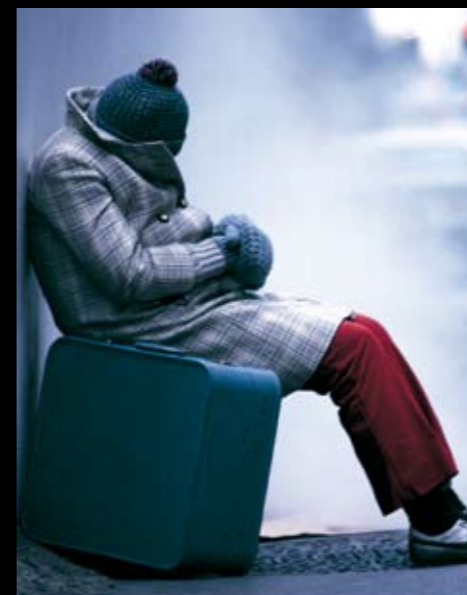
NUEVA YORK, ESTADOS UNIDOS