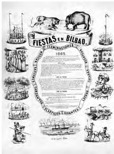
Programa de Fiestas de Bilbao 1865 Bilboko Jai programa