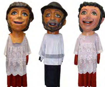
Apaiza eta monagilo bikotea El diácono y sus monaguillos (1980)