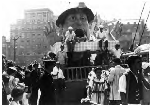
Gargantua 1962