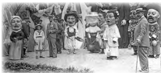
Cabezudos 1893 Buruhandiak (xehetasuna detalle)