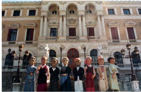
Generación de 1980ko Belaunaldia © Colección J. Gaminde Bilduma

Gaur egun, Bilboko auzoek beren erraldoiak dituzte: Basurton Beti Jai Alai dantza-taldeko lau erraldoiez gozatzen dute; Deustun, Ondalan Erraldoien Konpar sa dute erraldoiekin, mamutxekin eta erraldoitxoekin; eta Santutxun Mairuek Gaztediko Erraldoiak konpartsa dago. Urtero, Aste Nagusian eta beste ospakizun eta elkarretaratze batzuetan, 1988ko Erraldoiak, aurretik jende artean bidea egiten doazen hamar buruhandiak dituztela, Hiribiduko kaleetan eta plazetan barrera ibiltzen dira, dantzariak dantzatuta, gaiten soinura eta txistulariek lagunduta. Denak Bizkaiko Dantzarien Biltzarreko kide dira.