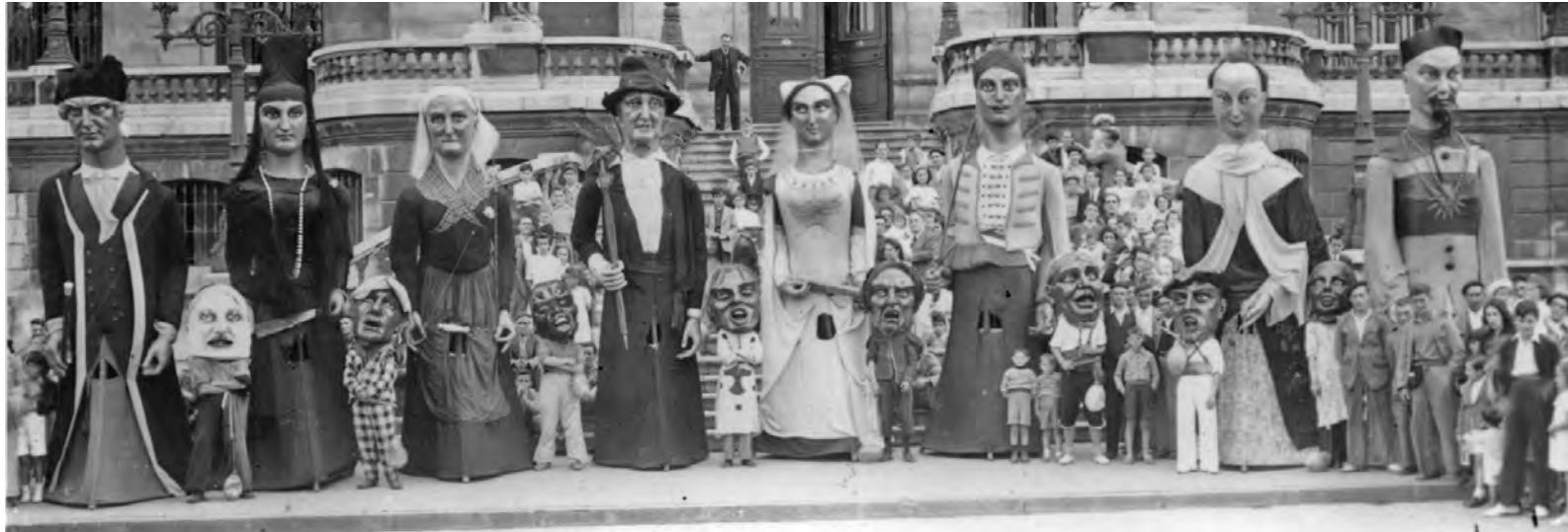
Generación de de Gigantes y Cabezudos 1939-1945ko Erraldoi eta Buruhandi Belaunaldia

Erraldoiak eta Buruhandiak, Gargantuarekin batera, Bilboko festa-imaginarioko protagonista saihestezin eta historikoak dira. 1978. urtetik, Aste Nagusian urtero berriz jaiotzen den Marijaiarekin batera, ezinbestekoak dira egun Bilboko Udalak dituen erraldoien eta buruhandien bi belaunaldiak. Udan Euskal Museora eramaten dituzte, eta nagusien eta txikien konpainia izaten dute bertan.