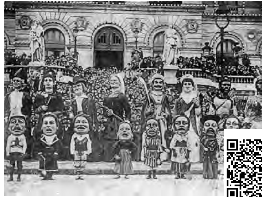
Generación de 1896ko Belaunaldia.