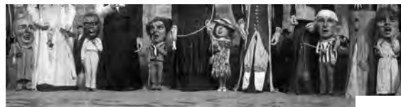
Generación de Cabezudos de 1934ko Buruhandi Belaunaldia (xehetasuna detalle) © F-000570 Euskal Museoa Bilbao Museo Vasco