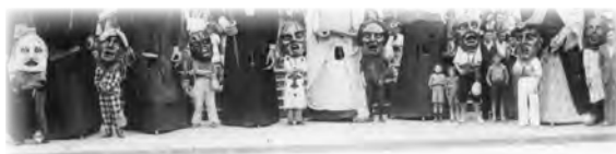
Generación de Cabezudos de 1939-45 ko Buruhandi Belaunaldia (xehetasuna detalle)