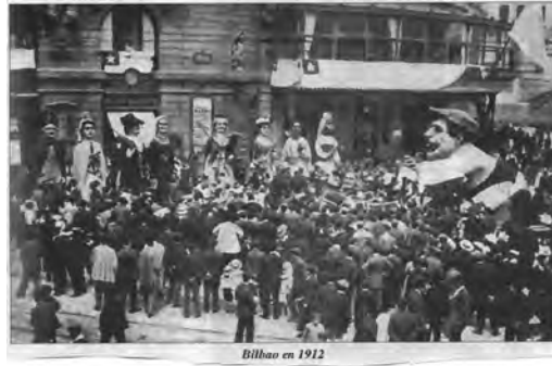
Gargantua