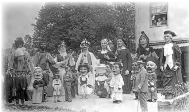
Gigantes y Cabezudos 1893 Erraldoiak eta Buruhandiak © F-003828-1 Euskal Museoa Bilbao Museo Vasco