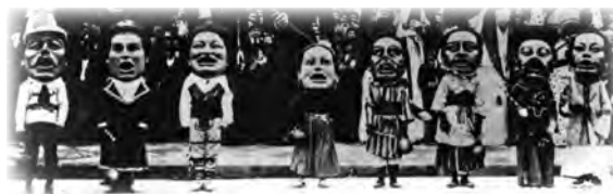
Generación de Cabezudos de 1896 ko Buruhandi Belaunaldia (xehetasuna detalle) © F-002578. Euskal Museoa Bilbao Museo Vasco