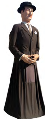
Gigante lehendakari Agirre Erraldoia © F/ Euskal Museoa Bilbao., 2017