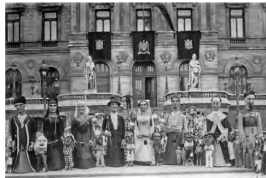
Generación de 1938-45ko Belaunaldia .