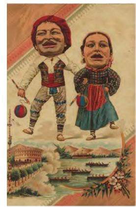
Programa de fiestas de Bilbao 1897 Bilboko Jai programa © Euskal Museoa Bilbao Museo Vasco 90/2216-2

La comitiva actual de cabezudos de Bilbao consta de diez personajes. Siete de ellos supervivientes de un séquito mucho más amplio perteneciente a la generación de Gigantes y Cabezudos de 1980, realizados por Kilikilariak – Cómicos de la Legua: un hombre y dos mujeres vestidos a la usanza medieval; el diácono con sus dos monaguillos (estos últimos, en origen, con diferente caracterización) y el Aldeano que algunos llaman Carbonero por su cara tiznada. Los tres restantes se han ido incorporando paulatinamente por iniciativa de las comparsas bilbainas.