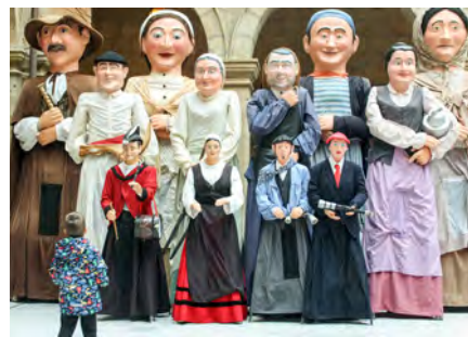
Erraldoi ONDALAN Konpartsa