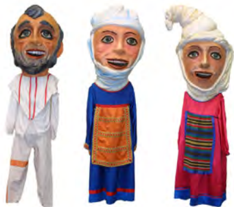
Erdi Aroko gizona eta emakumeak Tipos medievales (1980)

Por último, en 2012 Bilboko Konpartsak incorporó un cabezudo que personifica el diseño que Juan Carlos Eguillor realizó en 1978 para la Pañoleta Azul Bilbao de la primera Aste Nagusia y que representa el escudo de Bilbao tocado con txapela y pies para qué os quiero.