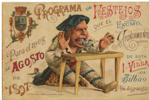
Programa de fiestas Bilbao 1897 Bilboko Jai programa N° 90/2216-1

Eta hura sortzen asmatu egin zuten, ‘El Nervión’ egunkariaren esanetan: “Hamahiru urtean (Gargantua) atrakzio nagusia izan zen, eta, ondoren, atsedean hartzen utzi zuten, garai hartan piztu ziren matxinadak eta asaldurak ikusita. Azkenean, 1874. urtean, Bilboko Setio tematian, antzinako udaletxean, bere kokalekutik gertu, eroritako bomba karlista bihozgabe batek txiki-txiki eginda utzi zuen. Auzotar guztiek bezala deseroso kokatua zuten leku hartan”.