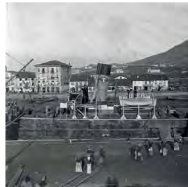
© F/ Eulalia Abaitua. Euskal Museoa - Bilbao Museo Vasco ABA-843