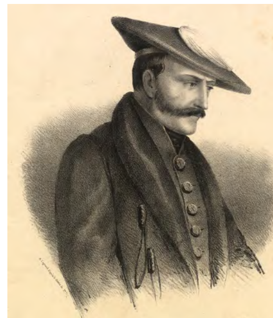
Retrato de Zumalakarregiren erretratua © Euskal Museoa Bilbao Museo Vasco, 81/1992