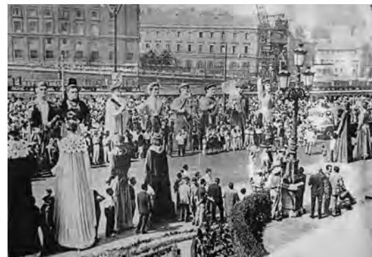
Generación de 1962o Belaunaldia .