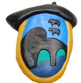
Bilboko ezkutua txapeldun eta oinekin Escudo de Bilbao tocado con txapela y pies para que os quiero (2012)