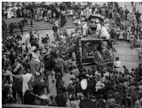
Gargantua Arriaga plazan/ en la plaza de Arriaga ©Eulalia Abaitua. Euskal Museoa Bilbao Museo Vasco ABA-845